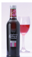
ハーブコーディアル(クランベリー&ハイビスカス) 375ml

ハイビスカスは、酸味(クエン酸)が強く、天然のビタミンCを豊富に含みます。クランベリーには赤ワインと同じポリフェノールが含まれています。また、クランベリーには有機酸も含まれ、美容にも健康にも良いと注目を集めています。