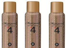
エンジェルガード 60g SPF50+ PA++++