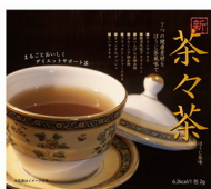
茶々茶(ちやちや茶)ほうじ茶風味 30包/10包入り 茶々茶(ちやちや茶)玄米茶風味 30包/10包入り

サラシアアオブロンガ・ブラックジンジャーをはじめ、7種類の植物のチカラで、糖質の抑制をサポート。「ダイエット」「デトックス」「美肌」のトリプル効果を実感できる顆粒タイプの健康サポートドリンクです。