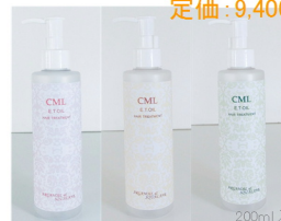
200ml入り(お得サイズ・ポンプ付き)

1.2ml×50粒入り 定価:@3,000円(税別) 50ml入り 定価:@2,200円(税別) 200ml入り 定価:@5,000円(税別)