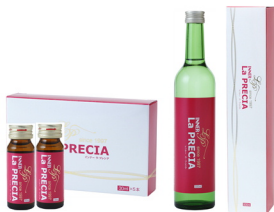
インナーラ・プレシア (30ml×5本入り/500ml入り)

1本(30ml)に濃縮プラセンタエキス5000mg、ビタミンC1000mgをはじめ、話題の美容成分、プロテオグリカン・ルチン・パッションフルーツ・ザクロエキス他高配合のプラセンタ美容ドリンクです。1日～2日あたり1本または1日あたり15ml～30mlを目安にお召し上がりください。30ml×5本入り 定価:3,750円 500ml入り 定価:10,000円