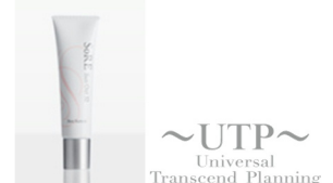
UTPサンアウト32 SPF32 30g

プラセンタエキス・アロエエキス配合で、お肌をケアしながら紫外線をカットします。ファンデーションにもなじみやすく、汗・水にも崩れません。白浮きを防ぎ、毛穴も目立たないので、下地としても最適です。あずき粒大をお顔全体や首にムラなく伸ばしてください。