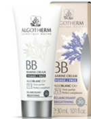
アルゴテルム BBマリンクリーム 30g入り SPF30 PA+++ * BBクリーム

ライトなテクスチャーのクリームが、紫外線や乾燥から素肌を守ると同時に、自然なメイクアップ効果によりシミやクスマを目立たなくさせます。朝、化粧水、美容液、クリーム等でお肌を整えた後、適量を顔と首全体になじませます。必要に応じて塗りなおしてください。