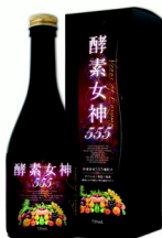
酵素女神555 720ml *高濃度酵素ドリンク

たっぷり720mlに希少5年天然熟成植物酵素400種+厳選ダイエツト&美容&健康成分155種をギュッと限界凝縮!全555種の酵素ドリンクで痩せる身体・太らない身体に!1日30～50mlを目安に、水やお湯で5～6倍程度に薄めてお召し上がりください。お好みでソーダ水、牛乳、豆乳などで薄めても美味しくお召し上がり頂けます。