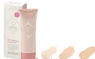
CCモイスタチャープロテクション 30g SPF50+ PA+++

BBよりもっと贅沢な。CCモイスタチャープロテクション。1本で5役のオールインワンクリームです。(日焼け止め, ファンデーション, 下地, 美容液, 保湿クリーム) カラー(3色): シャイニーオークル01, シャイニーオークル02, シャイニーオークル03