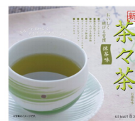
茶々茶(ちやちや茶)抹茶風味 30包/10包入り

60g入り(2g×30包) 定価:4,500円(税別) 20g入り(2g×10包) 定価:1,700円(税別)