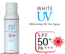
ピオ・プラントUVカットスプレー SPF50+ PA+++ 80g *薬用美白・日焼け止めスプレー【医薬部外品】

美白をしながら、大胆UVカット!ピオ・プラントUVカットスプレーは1本で全身ケアが可能な薬用美白・日焼け止めスプレーです。紫外線予防と美白効果をダブルで実感できます。