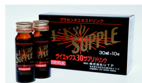
プラセンタドリンク ヴィエックス30 (30ml×10本入り)

1本(30ml)に濃縮プラセンタエキスが12,600mg配合されています。肝臓が弱っている方、更年期障害やアレルギーでお悩みの方にお勧めです。1日あたり1本を目安にお飲み下さい。