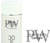
ピュアホワイト UVカットミルク 30ml SPF30 PA++

紫外線吸収剤を使わない紫外線散乱剤だけで効果を持たせた「ノンケミカルサンスクリーン」。安全性を高めた化粧下地兼乳液です。スキンケア効果も高くトリートメントパウダーの中の優れた5種類の美容成分がじっくりと肌になじみ、日焼けや乾燥・肌荒れなどのダメージからお肌を守ります。紫外線吸収剤を含まない、ノンパラベン、ノンケミカルタイプです。