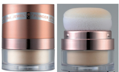
リアナニ 50CTジュエルパウダー 8g SPF50+ PA+++ * UVフィニッシングパウダー

リアルで上質な艶感と輝きをだすために、7種類<ダイヤモンド・エメラルド・サファイヤ・プラチナ・ゴールド・シルバー・パール>のジュエリーパウダーを使用。ジュエリーの輝きで潤いと立体感のあるシャイニー感を、極上の艶肌に導く瞬間フィニッシングパウダーです。合成着色料(タル系色素)一切不使用です。