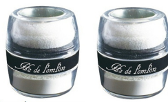
水素のボンボン 4g SPF50 PA+++ * 水素のフェースパウダー

お肌の上でボンボンとパウダーをなじませることでリフトアップ・小顔効果を体感できます。上品にきらめくパールがくすみをカバーし、洗練された明るい肌に仕上げ、透明感のある肌色に整えます。メイクしなくてもボンボンするだけで、カバーも美白もできる、驚きのフェースパウダーです。