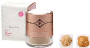
UVモイスタチャーフィニッシュパウダー 8g SPF50+ PA+++

パウダーなのに潤う。UVモイスタチャーフィニッシュパウダー。メイクの上からパウダーするだけの、新タイプのUVケア商品(日焼け止めパウダー)です。カラー(2色):パールライト, パールオークル