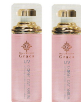
ガラサ コルセットデイセラム 30g SPF50 PA++++ * UVカット美容液

お肌を紫外線から守り、シワ、美白、保湿に絶大な効果を発揮。塗った瞬間から気になるシワ、毛穴を徹底ケア、カバーします。使い続けることで肌本来の働きを整え、輝きのあるオーラ肌を実現します。主要成分: プロテオグリカン、アルブチン、フェルラ酸、アルガンオイル、マトリキシル3000