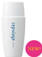
セパラージュ エクストラUVプロテクト 50ml SPF50+ PA++++

紫外線からお肌をしっかり守るウォータープルーフタイプのUVカット乳液です。美容(保湿)成分配合で、くすんだお肌にうるおいを与え、透明感のあるお肌に整えます。又、光を散乱させるソフトフォーカス効果により、キメの細かいなめらかなお肌を演出します。紫外線吸収剤不使用。 ※化粧下地としてもご使用できます。