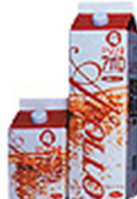
アポロパーメント 720ml・1800ml(リンゴ酢)

合成の保存料、着色料、甘味料を使用していない定番のパーメントドリンク(リンゴ酢)です。5～7倍に薄めてお召し上がり下さい。