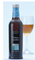
ハーブコーディアルDT(ディーティー) 375ml

りんご果汁をベースに砂糖を一切加えず、コリアンダーをはじめイギリス国内外の各地より厳選した良質で新鮮なハーブをブレンドし、自然の香りとおいしさを濃縮しました。いきいきと輝く美しさと、健康で快適な毎日をサポートします。